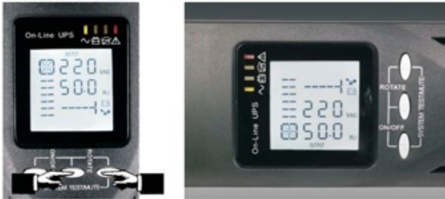
Универсальный формат - башня или стойка